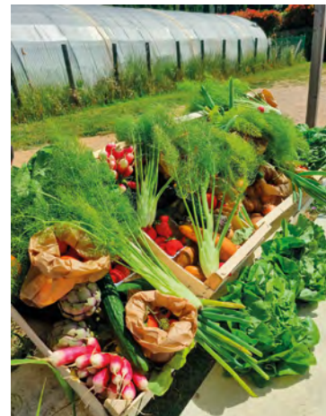
Paniers avant livraison.

Lancé en avril dernier, le service de livraison de fruits et légumes en entreprises « Bio à portée - Bio apporté », a déjà ses nombreux adeptes. On approche en quelques mois des 300 paniers de fruits et légumes, bio et de saison, livrés directement au bureau. Pour rappel, cette offre est réservée aux salariés des entreprises adhérentes de l'Adeto. Deux types de paniers sont proposés : un à 20 € et un autre à 35 €. Une formule sans abonnement, vous commandez quand vous en avez envie et les livraisons ont lieu chaque jeudi, entre 14h et 16h au sein de votre entreprise. C'est une agricultrice d'Ollioules* qui s'en charge, car le but de la démarche proposée par l'Adeto est de limiter les intermédiaires pour assurer un juste prix. Mangez bien et bio, avec ce dispositif cela n'a jamais été aussi simple, puisque dorénavant les paiements peuvent se faire en CB ou encore en carte Tickets Restaurants. Vous recevrez également en début de semaine la proposition de panier directement par SMS. Une action qui s'inscrit dans le cadre du Programme Alimentaire Territorial (PAT) porté par la Métropole TPM, qui apporte à ce titre à l'Adeto un soutien technique et financier.