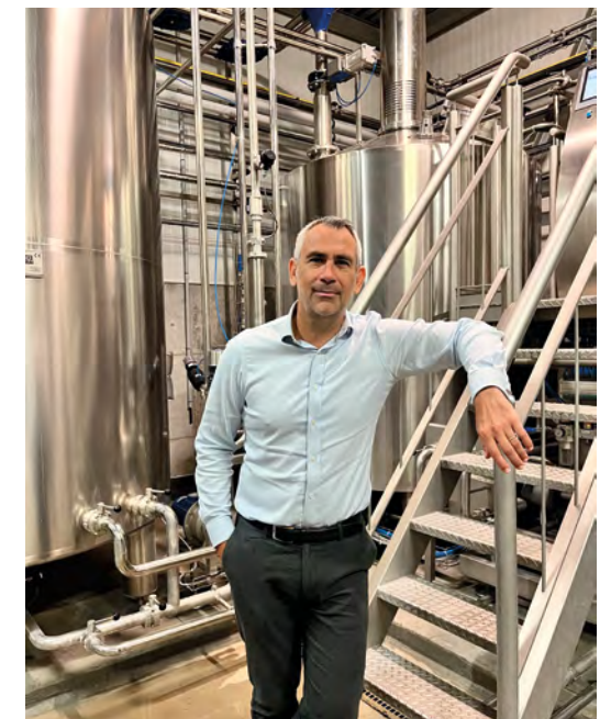
La brasserie dispose d'installations modernes et performantes.

Brasserie La Cig 153 Av. du Luxembourg 83500 La Seyne-sur-Mer 04 94 71 13 79 https://brasserie-la-cig.fr