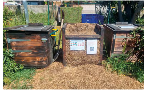
Site de compostage partagé.

Le site de compostage partagé, implanté à Ollioules et accueillant les biodéchets des professionnels de la restauration, a rempli sa mission expérimentale. Cette démarche lancée par l'Adeto et le GHR Paca en septembre 2023, soutenue par l'Ademe et la Région Sud, en partenariat avec des restaurateurs, un maître composteur, des agriculteurs locaux et la Ville d'Ollioules, a offert pendant une année un moyen de valorisation en circuit court. Pas moins de 600 kg ont été déposés, quantité certifiée par l'utilisation d'un QR code permettant à la fois le suivi de la qualité du tri et la traçabilité de l'élimination des biodéchets. Toujours est-il que le compost produit est d'excellente qualité et a été récupéré par une agricultrice d'Ollioules. Les deux restaurants qui ont été particulièrement impliqués dans cette expérience vont quant à eux installer leurs propres composteurs pour pérenniser la démarche. Pour aller plus loin, sans doute faudra-t-il imaginer des solutions de collecte et de valorisation en proximité, simples d'utilisation et peu coûteuses. C'est ce témoignage que partage l'Adeto auprès d'autres zones d'activités intéressées par cette démarche, dont l'enjeu est certes environnemental mais aussi économique !