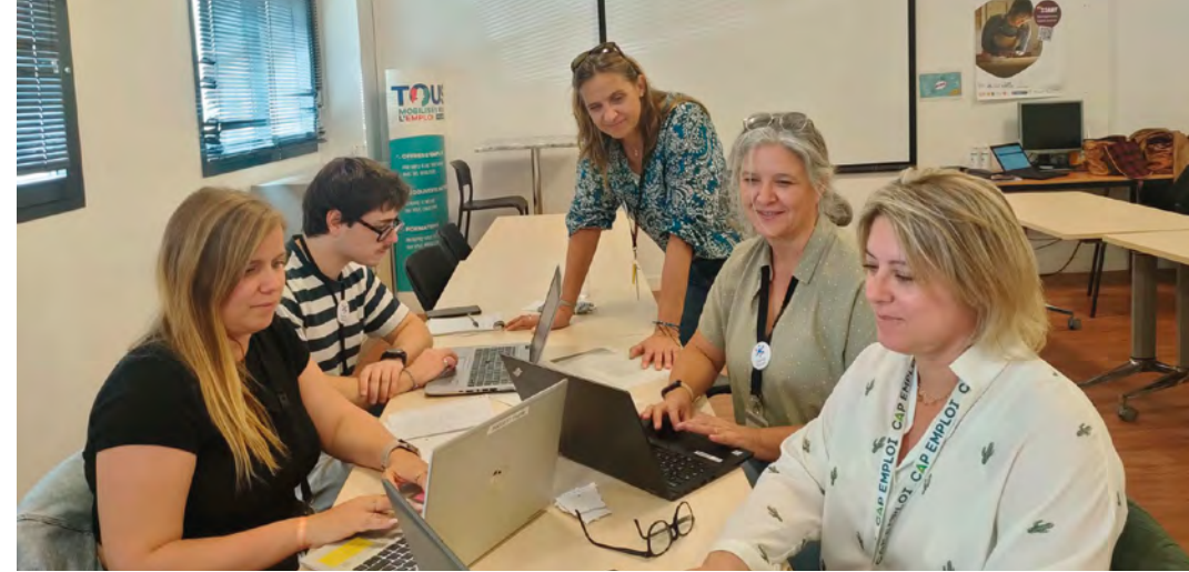
Les équipes ont commencé à se coordonner.

Durant la Semaine de l'Industrie en novembre, les équipes ont souhaité mettre en œuvre ce nouveau mode de fonctionnement sur la zone des Playes. Pendant plusieurs semaines, un travail concret de coordination a été mené entre les agences de France Travail, la Mission Locale et Cap Emploi, pour proposer des jobs dating, des découvertes d'entreprises, des moments d'immersion. En quelque sorte, une répétition de ce qui va devenir la règle dans le fonctionnement des acteurs de l'emploi d'ici quelques semaines.