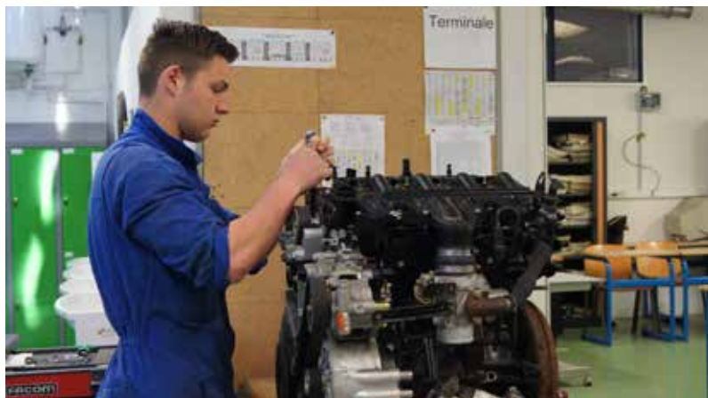
Les élèves bénéficient d'une formation pointue