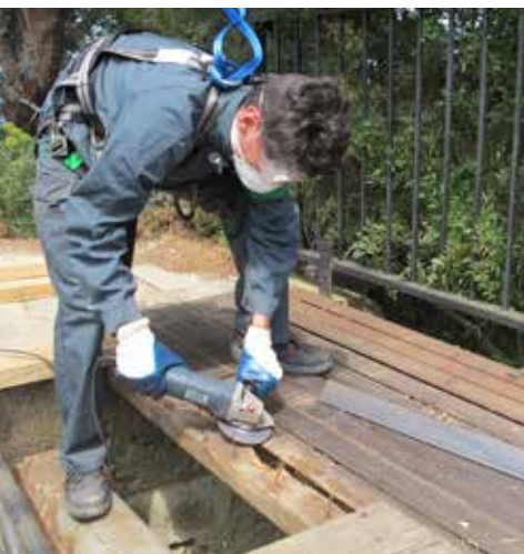
La ferronnerie d'art, une des filières d'excellence du Lycée Paul Langevin

L'objectif, in fine, est d'obtenir des spécialistes dans leur domaine d'activités, facilement employable : « Les jeunes qui sortent de chez nous avec un Bac pro « Chaudronnerie industrielle », « Maintenance industrielle », « Technicien menuisier agenceur » ou « Menuiserie aluminium/verre » trouvent du travail, notamment dans l'industrie du nautisme, entre La