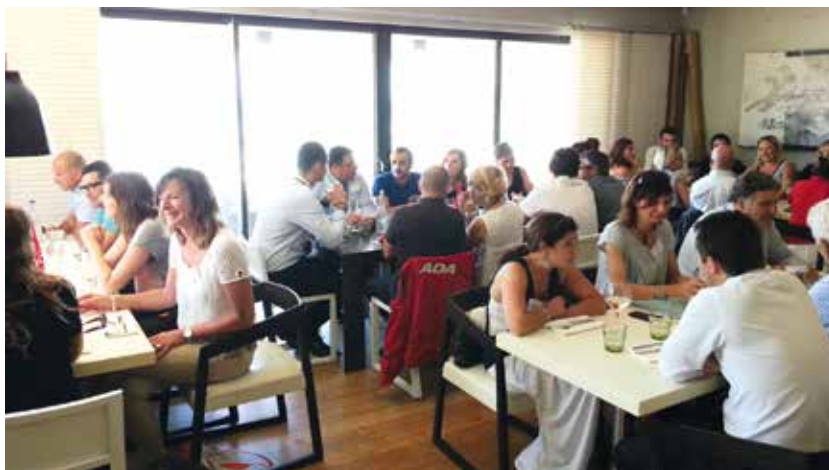
36 participants étaient présents pour ce dernier rendez-vous avant la période estivale

Nous vous donnons d'ores et déjà rendez-vous, le lundi 26 septembre pour la prochaine édition... D'ici-là, vous qui êtes adhérents, surveillez vos mails, nous vous informerons du lieu de cette rencontre.