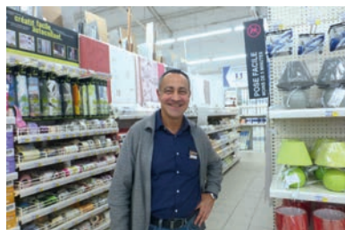
BRICO LECLERC Centre E.LECLERC La Seyne Avenue Jean Albert Lamarque 83500 La Seyne-sur-Mer 04 94 11 01 60 Ouvert du lundi au samedi de 9h à 19h