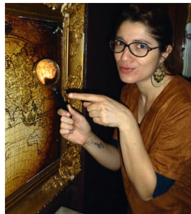
AENIGMA 6 allée des 4 Chemins 83130 La Garde 06 14 79 46 06 www.aenigma-live-escape-game.com